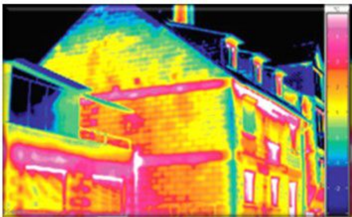
Σπίτι χωρίς μόνωση τοιχωμάτων