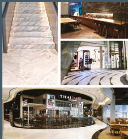
Qendra tregtare King Power Duty Free