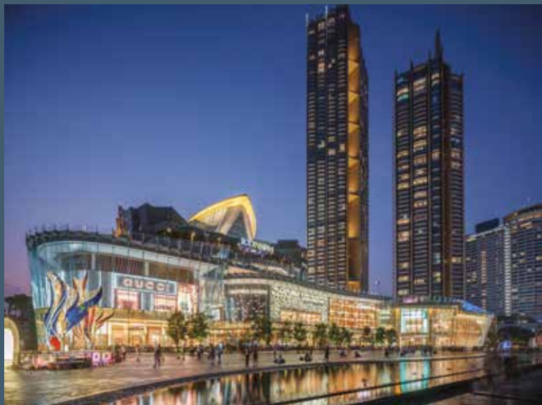
Qendra tregtare ikonike Siam