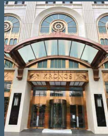
Zyrat e Kronos