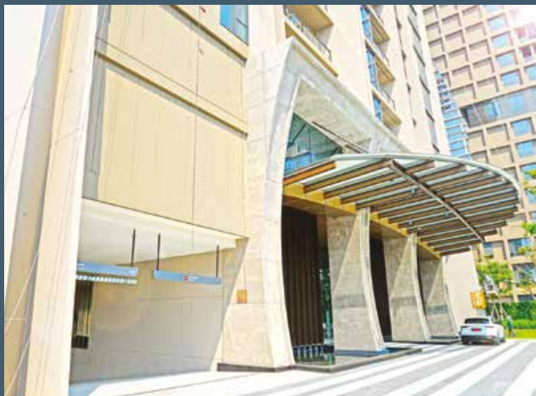
Hotel Sindhorn Kempinski